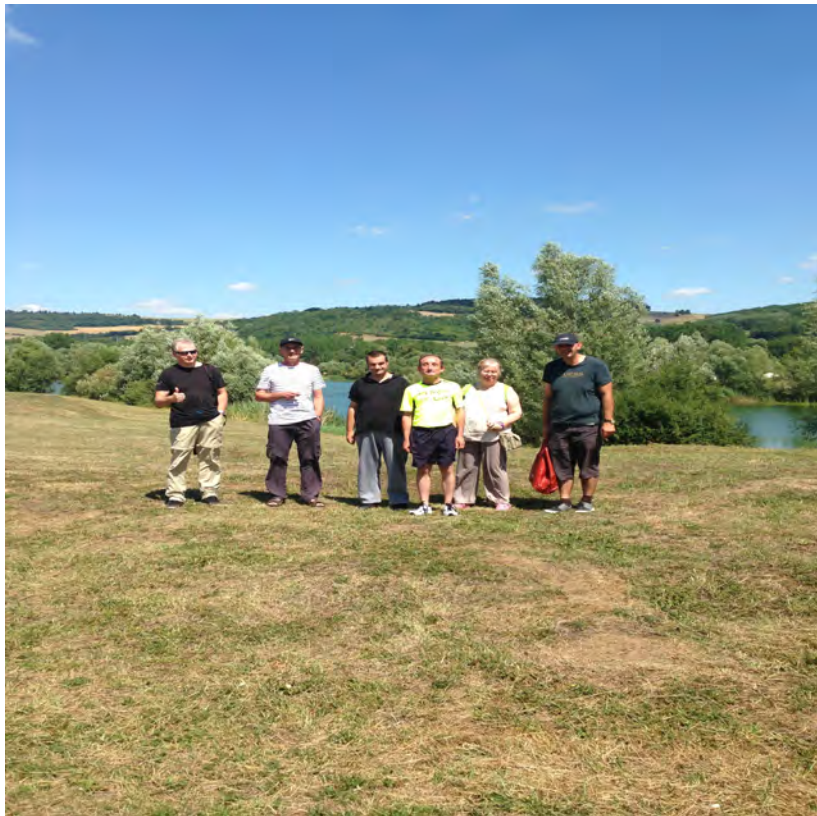
Plage du Grand bleu à PAM