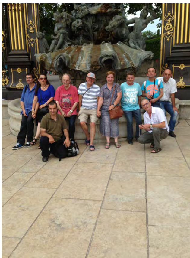
Place Stanislas, Nancy, Juillet 2015