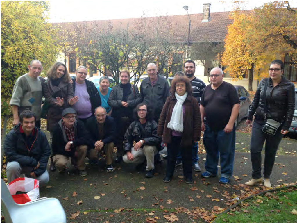
Le GEM de PAM accueilli au GEM de Neuves-Maisons