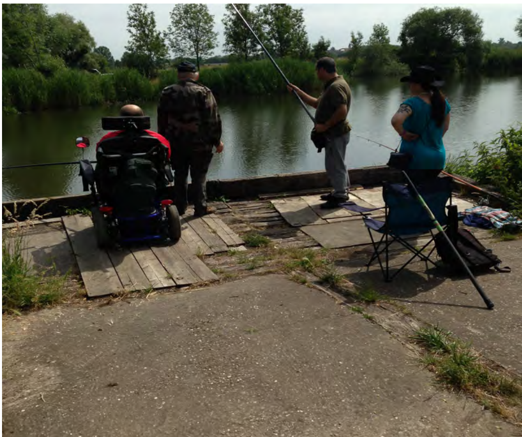
Journée barbecue/pêche à PAM, un classique de l'été!