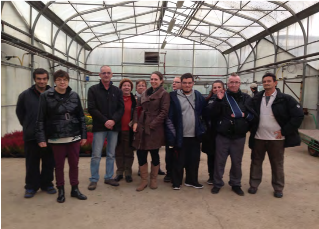
Visite de l'ESAT de Liverdun, Le Domaine des eaux bleues