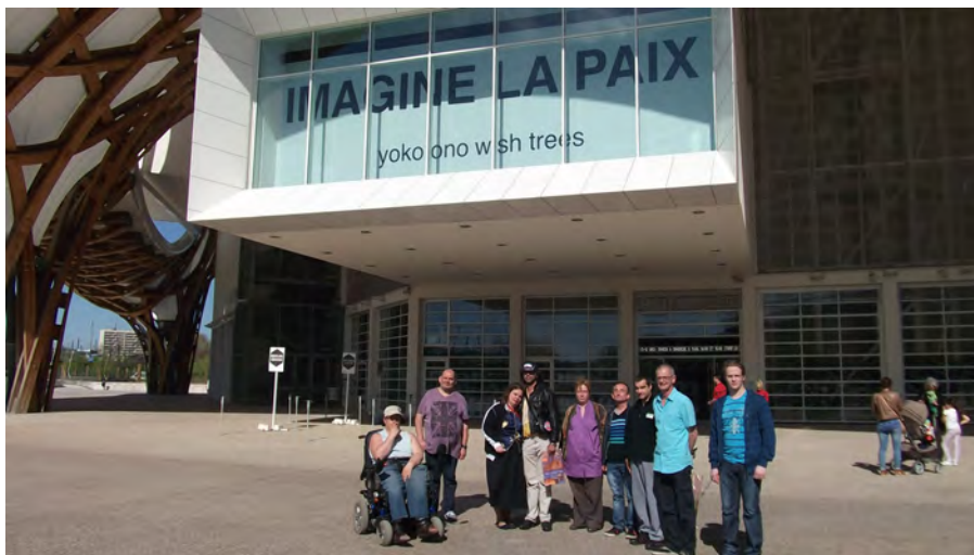
Centre Georges Pompidou de Metz