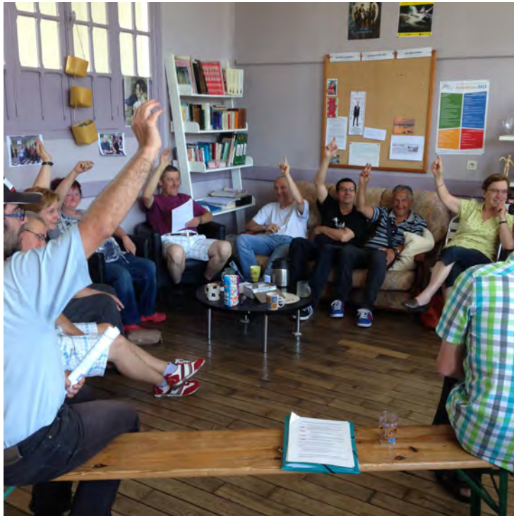
Juin 2015 : Assemblée Générale annuelle. Elections des membres du Bureau et du CA